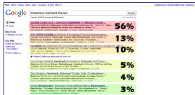
Mit jeder Position nehmen die Klickraten dramatisch ab - weit oben stehen lohnt sich also. Quelle: SEOResearcher/t3n

Dies ist ganz einfach - Ihre Webseite können Sie ganz einfach unter http://www.google.de/addurl/ anmelden.