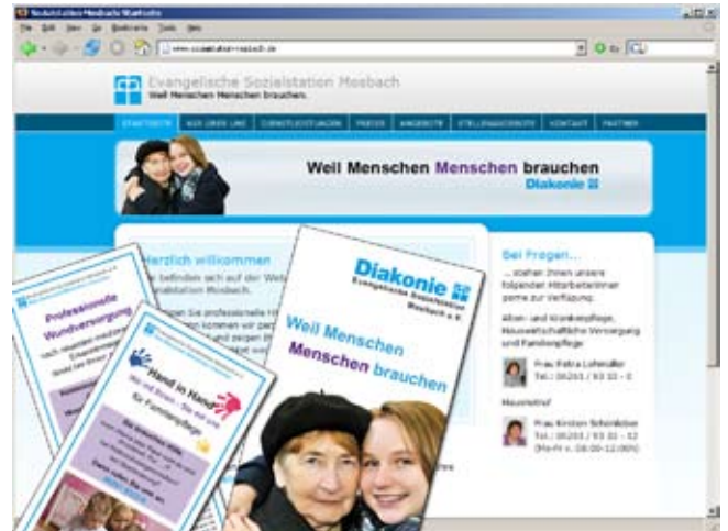
Im einheitlichen Erscheinungsbild präsentiert sich die Sozialstation Mosbach - markus slaby media half bei der Umsetzung.

In den vergangenen Monaten erstellte markus slaby media für die Sozialstation verschiedene Werbemittel: ein Imageflyer informiert allgemein über die Sozialstation und deren Dienstleistungsangebote. Zwei weitere Einleger können der normalen Post